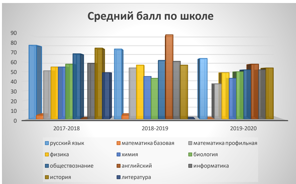
Сводная ведомость результатов ЕГЭ за 2019/2020 учебный год